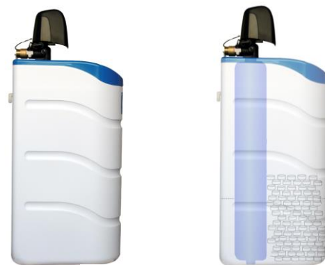
Schutztrafo 24 VAC